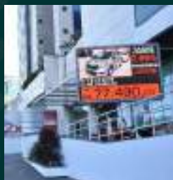
PAINEL FULL COLOR MÓVEL