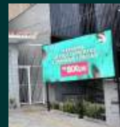
PAINEL FULL COLOR OUTDOOR