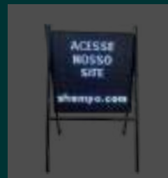
PAINEL DE OFERTAS