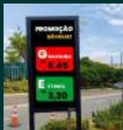
PAINEL DIGITAL INTERATIVO