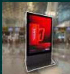
MUP DIGITAL COM BACKLIGHT