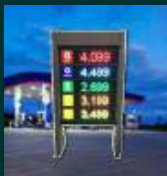
TOTEM E DISPLAY DE PREÇO