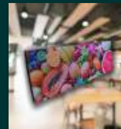
PAINEL FULL COLOR INDOOR