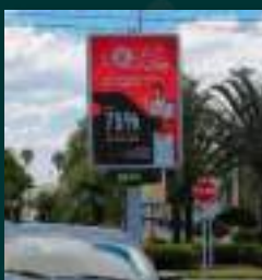
MOBILIÁRIO FULL COLOR