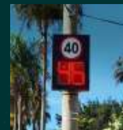
PAINEL INFORMATIVO DE VELOCIDADE