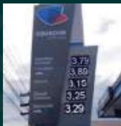
DISPLAY DE PREÇO